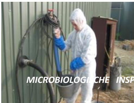
MICROBIOLOGISCHE INSPECTIE EU 1069/2009