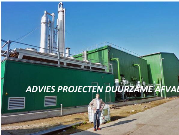
ADVIES PROJECTEN DUURZAME AFVAL RECYCLING

Met innovatie en advies willen we mee bouwen aan een duurzame maatschappij.