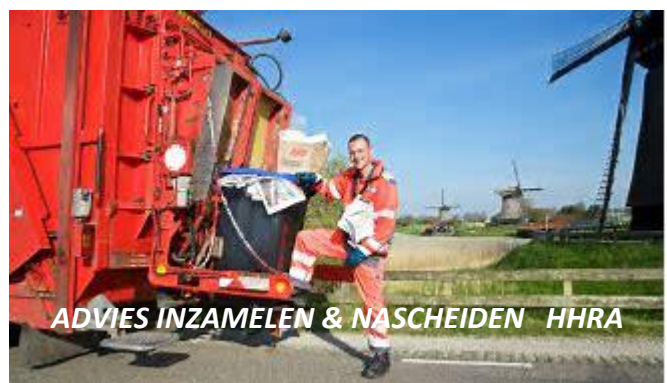
ADVIES INZAMELEN & NASCHEIDEN HHRA